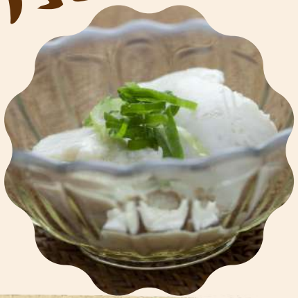
食のたね話 Part1 お豆腐づくり