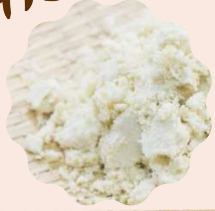
食文化のお話 おから味噌づくり